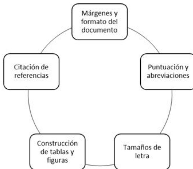
Figura 1. Elementos definidos en la Norma APA

Fuente: Adaptado desde APA (como se citó en Borda, 2016)